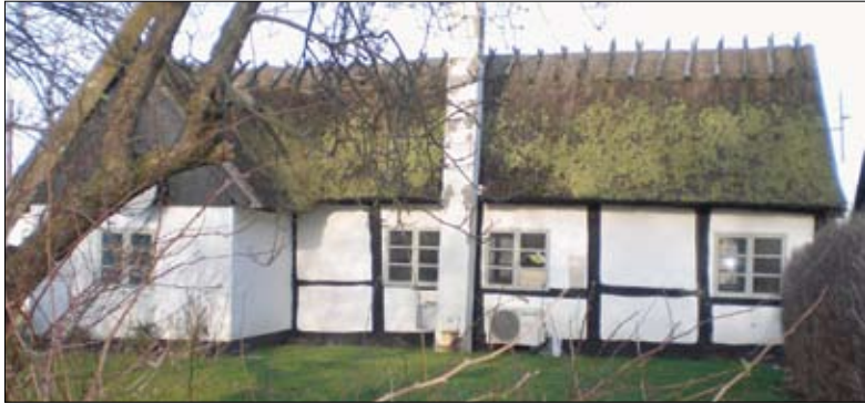
Det er Kærvej nr. 16 set fra sydsiden, billedet er taget fra Vængevej