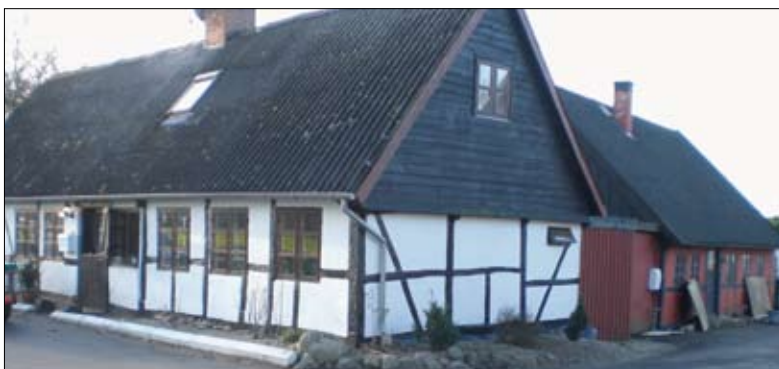
Dette billede viser til venstre Vængevej nr. 2 og til højre er det Skuderløse Bygade nr. 19.